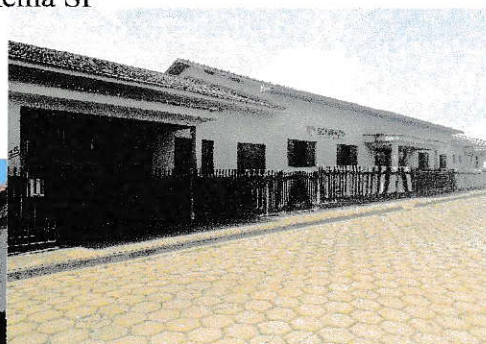
Unidade I Irmã Guilhermine